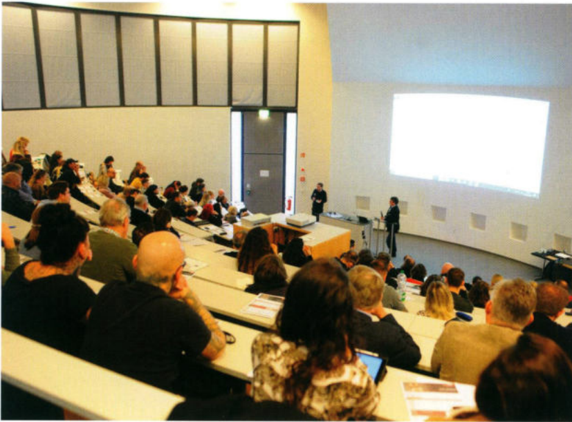
Voll besetztes Auditorium in Bochum.