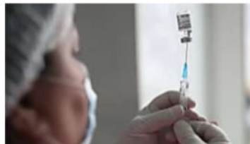
HÄUFIGE NACHIMPfung DENKBAR Immunschutz: Wie lange wirken die Covid-19-Impfstoffe?