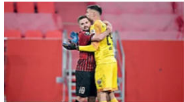
DAS IST DER NÄCHSTE GEGNER DES SV MEPPEN FC Ingolstadt will nach Relegations-Drama den Aufstieg