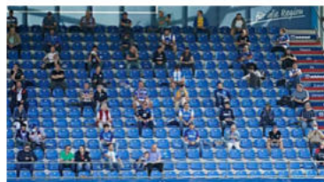
DIE FINANZEN DER AKTUELLE SAISON Wo dem SV Meppen ein Millionenverlust droht