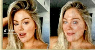
Yapay zeka tabanlı "Bold Glamour" filtresi eleştiriliyor.

Bunun yanı sıra genç görünmek istemeyip "ben" in en iyi versiyonuna ulaşmayı hedefleyen bir kesim de var. Yani aslında görünümün hâlâ yaşa uygun bir versiyonu, ancak o yaşta mümkün olan en iyi versiyonunu temsil ediyor. Burada çok şey gelişti. Ameliyat tarafını bir kenara bırakacak olursak özellikle hyaluronik asit dediğimiz dolgu maddelerinin iyileştirilmesi, ayrıca radyo