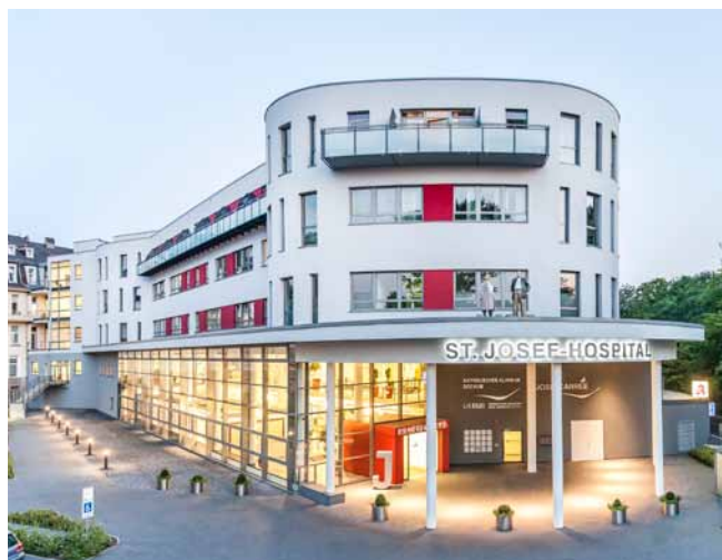
St. Josef-Hospital, JosefCarrée