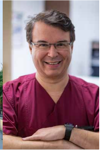
St. Josef-Hospital, JosefCarrée